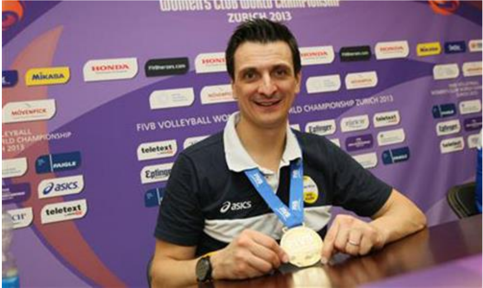
VAKIFBANK SPOR KULÜBÜ VOLEYBOL ANTRENÖRÜ GIOVANNI GUIDETTI